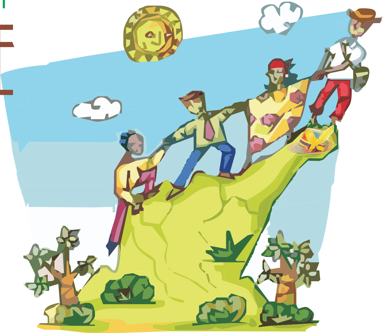
La finca de Papá Caribe: CIPOTÚA

Pero primero, somos caribes. Es el único caso en esta Colombia grande y hermosa: ocho departamentos con sentido de nación. Ese sentido, el de Nación, es la Mamá. Es decir, la esposa de Papá Caribe: Doña Mamá Caribe. En buen costeño: “La Niña Cari”.